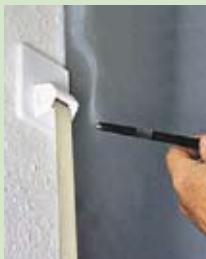
nachher Nach dem Einbau der Sanierungs- Gurtführung ist die zugige Schwachstelle eliminiert.