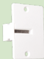
Gurtführung von vorne.