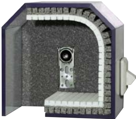
Revision von unten 2-teilige Dämmung mit Fuge am Verschlussdeckel