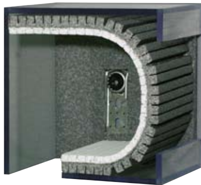
Revision von vorne 1-teilige Dämmung