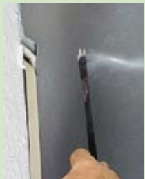
vorher Die Luft bläst durch die Gurtführung